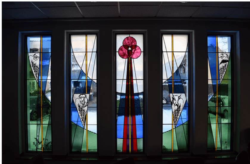
Evangelistenfenster Ev. Kirche Kaarst Büttgen

Alle diese Fenster weisen eine wunderbare farbliche Gestaltung auf und enthalten – sofern sie im kirchlichen Zusammenhang stehen – ganz bewusst deutlich erkennbare christliche Motive und Symbole.