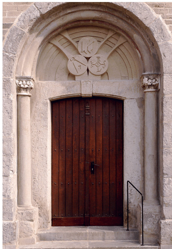
Tympanon Alt St.Martin, Kaarst

Die untenstehenden Abbildungen zeigen das von Burkhard Siemsen entworfene Tympanon über dem Hauptportal der Kirche Alt St. Martin in Kaarst und die in Zusammenarbeit mit der Künstlerin Rose Köster und dem Künstler Christoph Rehlinghazus gestaltete Europastele, ein Wendel, der sich auf einem Kreisverkehr der Umgehungsstraße von Büttgen (L 154) 8,20 m in die Höhe schlängelt und der als Symbol für das geistige Europa und das Wachstum der Europäischen Union steht.