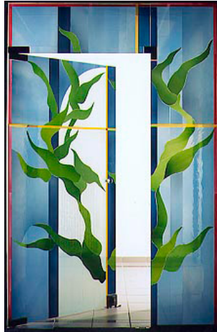
Caritashospiz Düsseldorf Garath